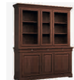
7506 cm 178x50/215 in 70.1x19.7/84.6