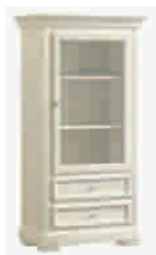
7502D cm 77x42/153 in 30.3x16.5/60.2