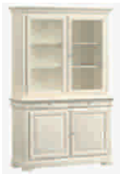
7505D cm 139x50/215 in 54.7x19.7/84.6