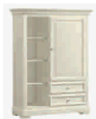
7504D cm 112x42/153 in 44.1x16.5/60.2