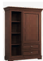
7504 cm 112x42/153 in 44.1x16.5/60.2