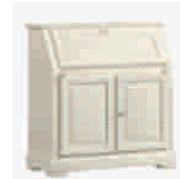
6501D cm 100x44/103/74 in 39.4x17.3/40.6/29.1