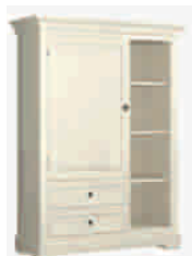
7508D cm 112x42/153 in 44.1x16.5/60.2