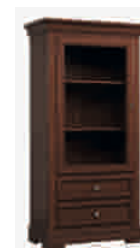
7507 cm 77x42/153 in 30.3x16.5/60.2