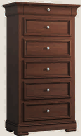
CONSTANTIA 5502 Kommode Comò Chest of drawers