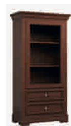
7502 cm 77x42/153 in 30.3x16.5/60.2