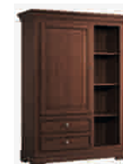
7508 cm 112x42/153 in 44.1x16.5/60.2