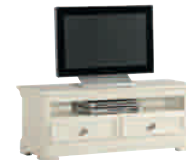
5503D cm 130x45/51 in 51.2x17.7/20.1