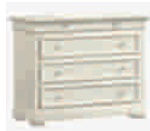
5501D 120x50/93 47.2x19.7/36.6