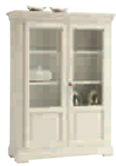
7503D cm 112x42/153 in 44.1x16.5/60.2