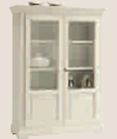
CONSTANTIA 7503D Sammlevitrine Vetrina Collector's china cabinet