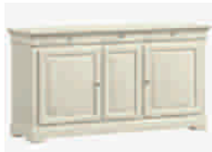
7501D cm 177x50/93 in 69.7x19.7/36.6