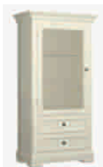
7507D cm 77x42/153 in 30.3x16.5/60.2