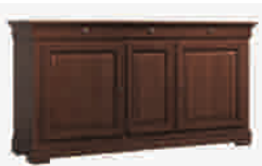
7501 cm 177x50/93 in 69.7x19.7/36.6