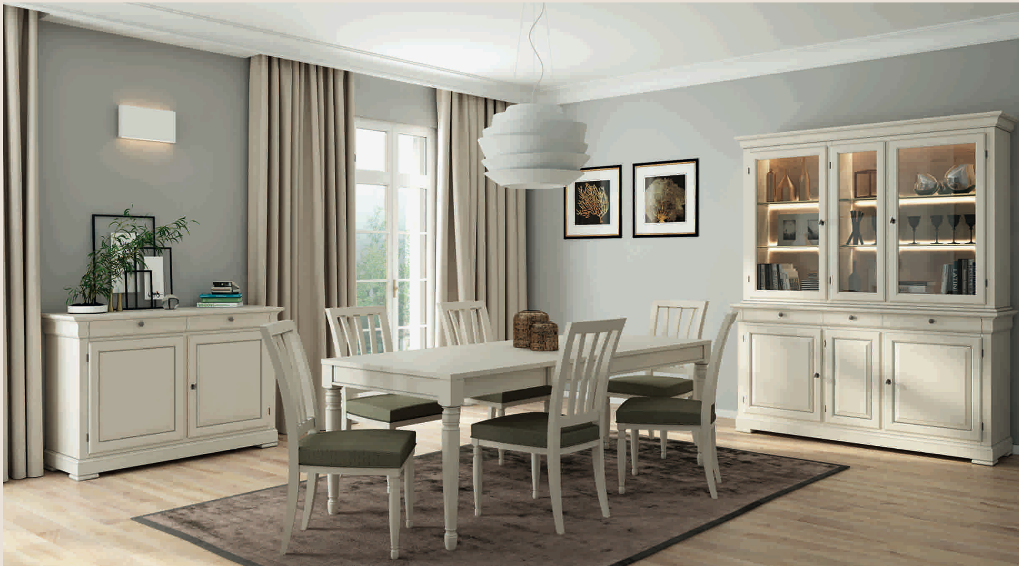
CONSTANTIA 7500D Anrichte Credenza Sideboard