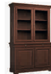
7505 cm 139x50/215 in 54.7x19.7/84.6