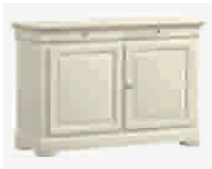
7500D cm 138x50/93 in 54.3x19.7/36.6