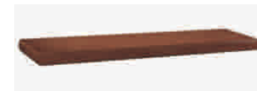
8284-8285-8218-8286 cm 100x30/5 in 39.4x11.8/2 cm 130x30/5 in 51.2x11.8/2 cm 150x30/5 in 59.1x11.8/2 cm 180x30/5 in 70.9x11.8/2