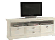
5504D cm 177x45/67 in 69.7x17.7/26.4