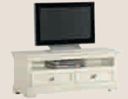
CONSTANTIA 5503D TV Möbel Mobile porta TV TV cabinet