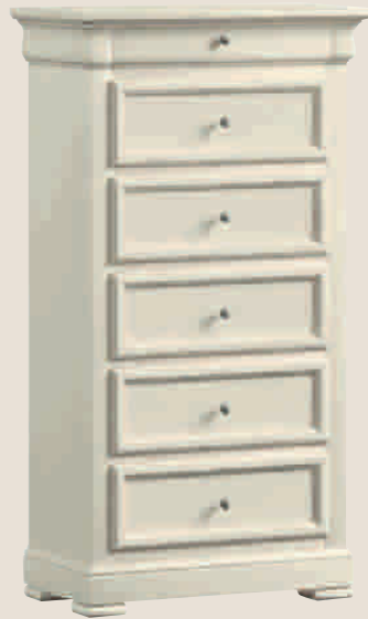
CONSTANTIA 5502D Kommode Comò Chest of drawers