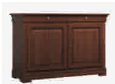
7500 cm 138x50/93 in 54.3x19.7/36.6