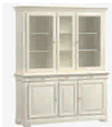
7506D cm 178x50/215 in 70.1x19.7/84.6