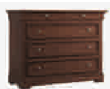
5501 120x50/93 47.2x19.7/36.6