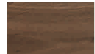
Rückwand in Eiche Schienale in rovere Back in oak

Please note that the lamp set should be professionally installed by a qualified workman. The lighting sets include light bulbs, transformers, and wiring including the corresponding plug connectors.