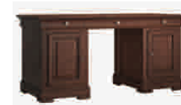
6500 cm 160x70/77 in 63x27.6/30.3