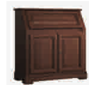
6501 cm 100x44/103/74 in 39.4x17.3/40.6/29.1