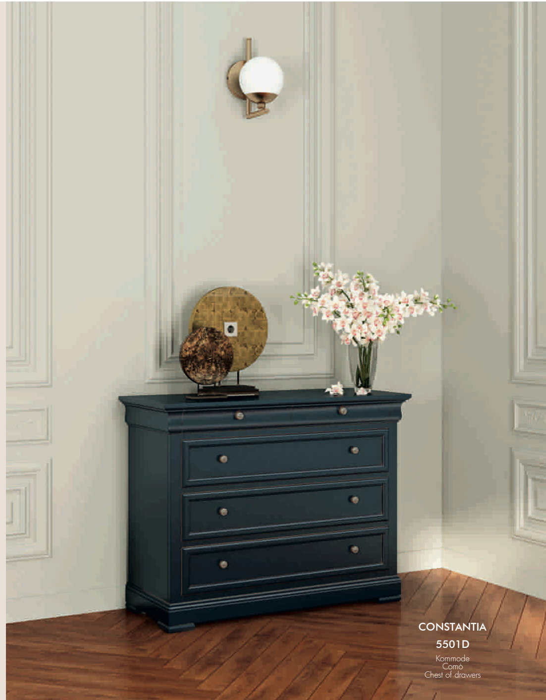
CONSTANTIA 5501D Kommode Comò Chest of drawers