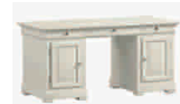
6500D cm 160x70/77 in 63x27.6/30.3